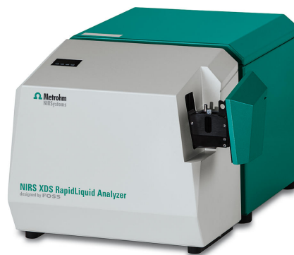
Figure 1. NIRS XDS RapidLiquid Analyzer 有 1 mm 石英比色皿, 用于收集表面活性品的光。