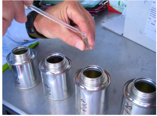
Figure 1. 品填充在路径度 8 毫米的一次性小瓶中。

在配 8 mm 一次性玻璃瓶的 NIRS XDS RapidLiquid Analyzer 上分析了 99 个 pygas 品。所有量均在 400 nm 至 2500 nm 的透射模式下进行。温度控制置 40 ° C,以提供稳定的品质。方便起见,使用了路径度 8 mm 的一次性小瓶,使得清程序。Metrohm 件包 Vision Air Complete 用于数据采集和模型。