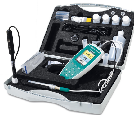
Figure 1. 箱包括所有附件和配 O 2 -Lumitrode 和率传感器的 914 pH/DO/, 用于定淡水流中的溶解。