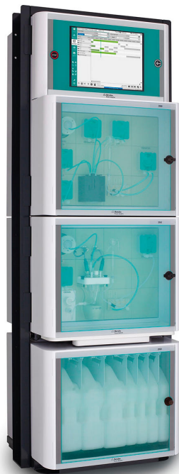
Figure 2. 2060 TI Process Analyzer para análise on-line de parâmetros críticos de qualidade em banhos de decapagem usando o método de titulação.

os custos operacionais e de descarte de produtos químicos são consideravelmente reduzidos. Metrohm Process Analytics oferece um analisador de processo multiparametro adequado para análise simultânea de \text{Fe}^{2+}/\text{Fe}^{3+} e relação ácido livre/ácido total em uma ampla faixa de concentração - o Analisador de Processo 2060 TI (Figura 2) .