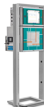
Figure 3. 2060 The NIR-Ex Analyzer di Metrohm Process Analytics.

Ogni Metrohm Process Analytics 2060 The NIR-Ex Analyzer è configurato per applicazioni in zone ATEX. Questi strumenti sono in grado di monitorare fino a cinque punti di processo per armadio NIR con l'opzione multiplexer.