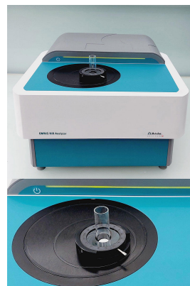
Figure 1. OMNIS NIR Analyzer Solid con fiala da 15 mm e supporto flessibile OMNIS NIR.

In questo studio, 17 compresse di paracetamolo con attività dell'acqua variabile ( 0,23-0,85 a_w ) sono state misurate su OMNIS NIR Analyzer (Figura 1) per creare un modello di previsione per la quantificazione. I campioni sono stati misurati in modalità riflessione (1000–2250 nm) in fiale da 15 mm utilizzando un supporto flessibile e misurazione a punto singolo. I valori di riferimento sono stati misurati secondo USP<922> Water Activity [3].