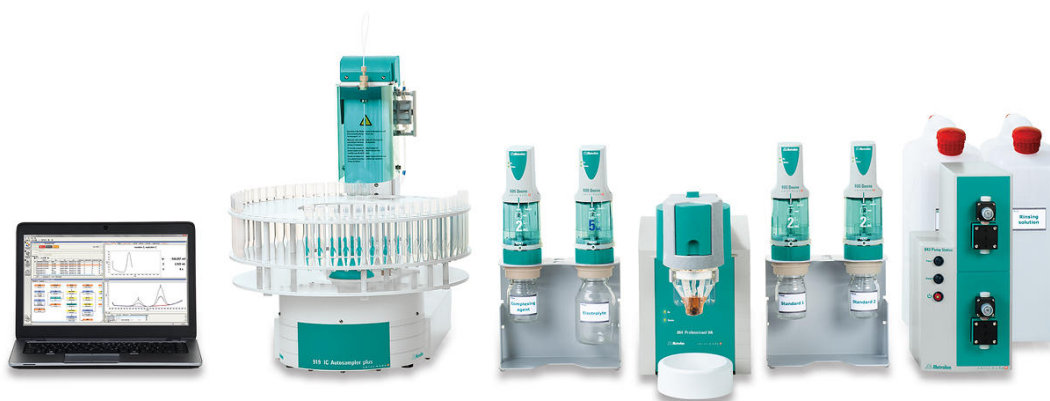
Figure 2. 884 Professional VA fully automated for VA