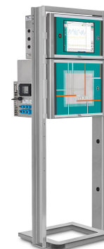
Figure 2. El analizador NIR-Ex 2060 de Metrohm Process Analytics es adecuado para su uso en áreas peligrosas.

Metrohm Process Analytics fabrica analizadores de procesos NIRS que recopilan datos espectrales del proceso en «tiempo real». Se utilizan para comparar con un método primario (p. ej., titulación Karl Fischer) para crear un modelo simple pero indispensable para monitorear fácilmente los parámetros de control de calidad casi en tiempo real. Obtenga más control sobre el proceso de refinación con una 2060 El Analizador NIR-Ex configurado para aplicaciones en zonas ATEX ( Figura 2 ). Este analizador de procesos es capaz de monitorear hasta cinco puntos de muestra por gabinete NIR con la opción de multiplexor.