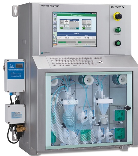
Figure 2. Analizador a prueba de explosiones ADI 2045TI apto para ASTM D8045.

2045TI (Figura 2) puede monitorear la acidez del petróleo crudo de acuerdo con los procedimientos de prueba ASTM D8045. Al monitorear la acidez del petróleo crudo y los productos asociados, se ahorrarán millas de millones de dólares anuales al evitar paradas inesperadas y preservar los costosos productos químicos de tratamiento.