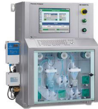
Figure 2. ADI 2045TI Ex proof (ATEX) Analyzer.

El cloruro se analiza con detección de conductividad como se describe en ASTM D3230 con el analizador a prueba de explosiones ADI 2045TI (Figura 2).