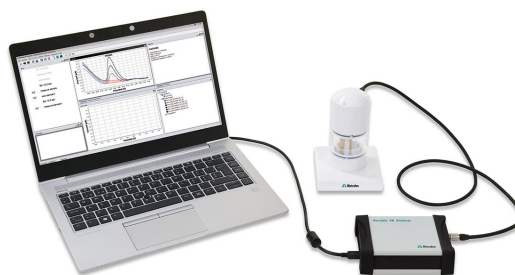
Figure 1. Analizador portátil de AV 946 (SPE)

Antes de la primera determinación, se deposita una película de bismuto ex situ a partir de una solución de Bi. En el siguiente paso, los electrodos se limpian con agua ultrapura y se elimina la solución de bismuto. La muestra de agua se coloca en el recipiente de medición. Se añade tampón amoníaco/cloruro de amonio junto con el agente complejante (dimetilgloxima), y se realiza la determinación simultánea de níquel y cobalto utilizando los parámetros especificados en tabla 1 . La concentración se determina mediante dos adiciones de una solución estándar de adición de níquel y cobalto.