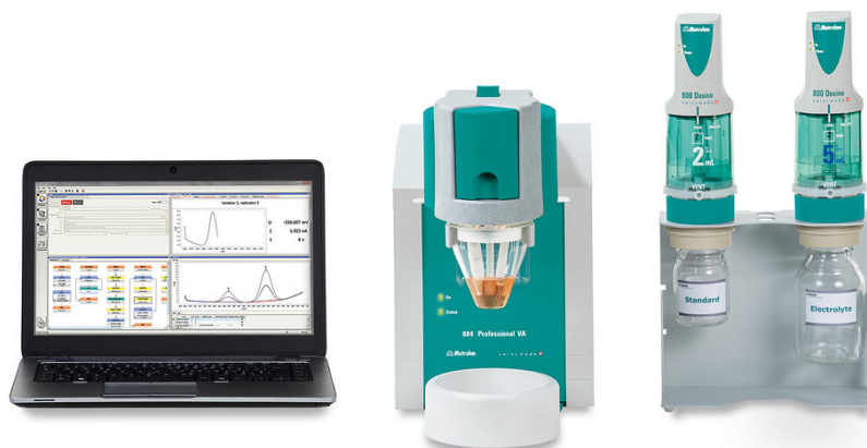
Figure 2. 884 Professional VA semiautomatizado