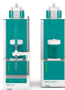
Figure 1. Sistema OMNIS para la medición del valor de saponificación en aceites comestibles que consta de un valorador avanzado OMNIS y un módulo de dosificación OMNIS equipado con un dSolvotrode.

Se obtienen curvas pronunciadas y suaves para ambos aceites. Los resultados son muy reproducibles con desviaciones estándar relativas por debajo del 0,3 %.