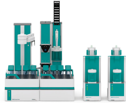
Figure 1. Robot de muestra S con funcionalidad Dis-Cover, módulo de dosificación y titulador avanzado OMNIS equipado con dPt Titrode para la determinación del valor de peróxido en aceites comestibles.

A una cantidad razonable de muestra, se añaden automáticamente una mezcla de disolventes (que contiene ácido acético) y una solución auxiliar (solución saturada de yoduro de potasio). Después, la solución resultante se agita durante un minuto para completar la reacción. Se añade agua desionizada y se titula la muestra con tiosulfato de sodio estandarizado hasta alcanzar el punto de equivalencia.