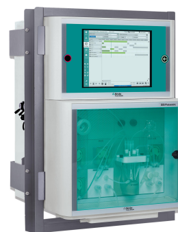
Figure 3. Analizador de procesos 2035.

Además, los sensores de pH en línea se pueden conectar al analizador de procesos 2060 para garantizar un sistema completamente integrado, lo que lleva a un mejor control del proceso.