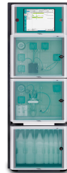
Figure 2. Analizador de procesos 2060.

Para extraer los compuestos adecuados, mantener el pH dentro de las especificaciones y preparar los mismos sabores en múltiples lotes, tanto la alcalinidad como la dureza del proceso y el agua de reposición deben controlarse y mantenerse en los niveles adecuados. Los analizadores de procesos Metrohm Process Analytics 2060 y 2035 ( Figuras 2 y 3 ) son ideales para la ejecución totalmente automática de estos importantes análisis, así como parámetros adicionales como el pH o la conductividad. El analizador de procesos puede enviar una alarma al sistema de control de la planta si los niveles de alcalinidad o dureza no son óptimos, indicando al control de distribución que corrija la química del agua, asegurando una calidad constante del producto.