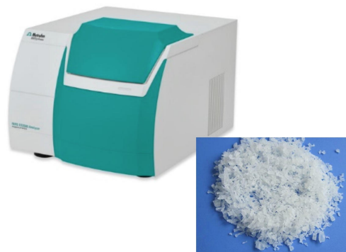
Figure 1. Se utilizó el analizador de sólidos DS2500 para recopilar los espectros del polímero de PVA.

Se recopilaron 54 espectros de 18 lotes de muestras diferentes utilizando un analizador de sólidos Metrohm DS2500 en combinación con el software de espectroscopia Vision Air Complete. Para superar la falta de homogeneidad de la muestra, la medición se realizó con una copa de muestra grande en rotación. Los valores de referencia se obtuvieron por titulación. La detección de valores atípicos se realizó en espectros preprocesados ( 2^{\text{Dakota del Norte}} derivada) usando una distancia máxima en el algoritmo del espacio de longitud de onda. El modelo de predicción NIRS se creó con la configuración descrita en la siguiente tabla y se validó mediante validación cruzada.