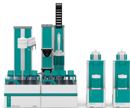
Figure 1. Robot de muestra S con funcionalidad Dis-Cover, módulo de dosificación y titulador avanzado OMNIS equipado con dPt Titrode para la determinación del valor de peróxido en aceites comestibles.

A una cantidad razonable de muestra, se añaden automáticamente una mezcla de disolventes (que contiene ácido acético) y una solución auxiliar (solución saturada de yoduro de potasio). Después, la solución resultante se agita durante un minuto para completar la reacción. Se añade agua desionizada y se titula la muestra con tiosulfato de sodio estandarizado hasta alcanzar el punto de equivalencia.