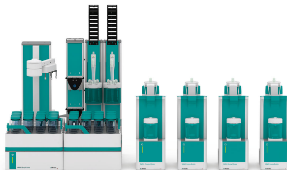
Figure 1. El robot de muestra OMNIS S está equipado con un titulador profesional OMNIS, más una cantidad correspondiente de módulos de dosificación OMNIS para agregar todas las soluciones necesarias y un titulador dPt para la determinación automatizada del valor de yodo.

Se pesa una cantidad adecuada de muestra en el vaso de valoración, luego se cubre el vaso con una tapa y se coloca en el soporte de muestras. Antes de la titulación, se agregan ácido acético glacial, solución de Wijs (ICI) y solución de acetato de magnesio y la solución se agita durante cinco minutos. Posteriormente se anade solución de yoduro de potasio y se titula la solución con tiosulfato de sodio estandarizado hasta después del punto de equivalencia.