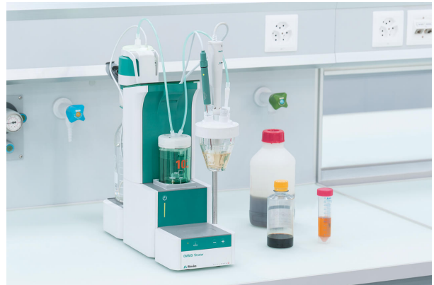
Abbildung 1. OMNIS Titrator Professional, ausgestattet mit einer dThermosonde und einem Stabrührer.

Titration leicht erwärmt oder in Xylol aufgelöst werden. Es ist möglich, warme Proben (<60 °C) zu titrieren, ohne dass die Auflösung oder Präzision beeinträchtigt wird.