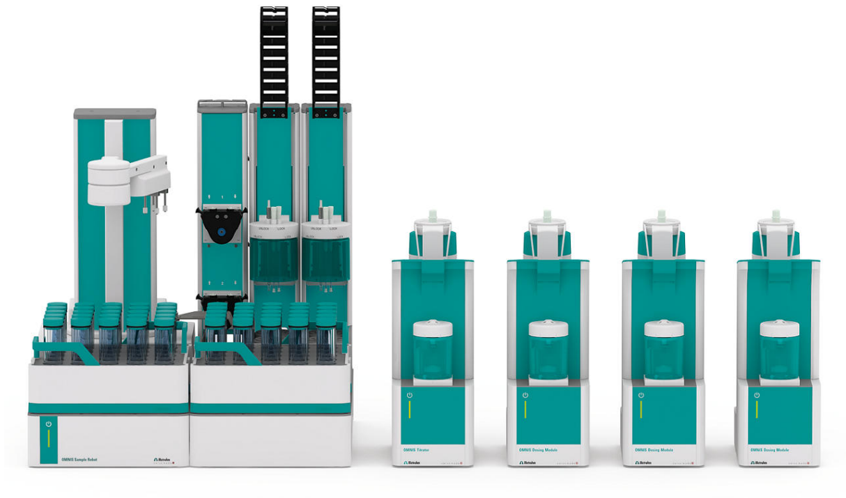
Abbildung 1. OMNIS Robot S mit Discover (Probenabdeckung) und paralleler Analyse.

OMNIS automatisiert den gesamten Analyseprozess mit: