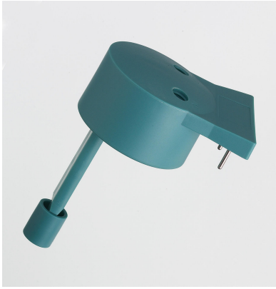
Messgefäß-Deckel für Stabilitätsmessgeräte Mit eingebauter konduktometrischer Messzelle.