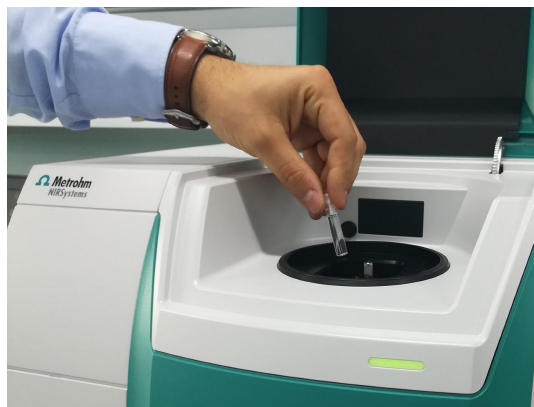
Abbildung 1. DS2500-Flüssigkeitsanalysator und eine in ein Einwegfläschchen gefüllte Probe.

17 Proben von drei verschiedenen CBD-Trägerölen (Hanf-, Fisch- und MCT-Öl (mittelkettige Triglyceride)) wurden im Transmissionsmodus mit einem DS2500 Liquid Analyzer gemessen. Die eingebaute Temperaturkontrolle wurde auf 40 °C eingestellt, um reproduzierbare Spektren zu erhalten. Der Einfachheit halber wurden Einweggefäße mit einer Schichtdicke von 8 mm verwendet, was die Reinigung der Probengefäße überflüssig machte. Das Metrohm-Softwarepaket Vision Air Complete wurde für die gesamte Datenerfassung und die Entwicklung von Vorhersagemodellen verwendet.