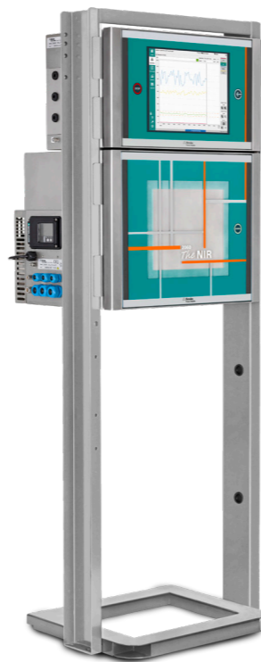
2060 The NIR-Ex Analyzer

En Metrohm Process Analytics, nuestros ingenieros calificados lo asesorarán sobre el mejor método de análisis y práctica de muestreo durante el periodo de consulta. Después de visitar el (los) punto(s) de muestreo, se generará una descripción general del proyecto junto con una oferta comercial.