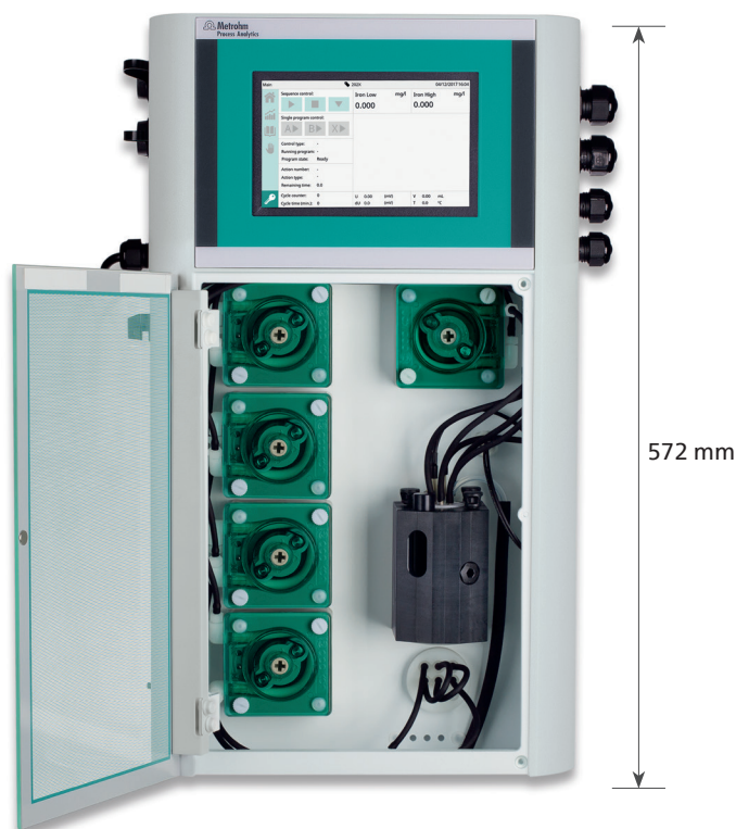
2029 Eisen Analyser